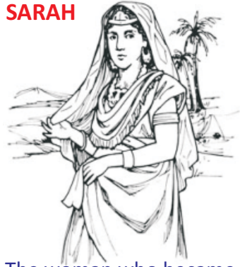
The woman who became mother of nations

The Testimony of the bible is that Sarah was unusually beautiful (Gen:12:11,14) when she was 90 years of age she was so lovely that Abraham feared that kings would fall in love with her beauty, Sarah is the only woman whose specific age is stated in scripture, others will be given us approximate age stating as "about".