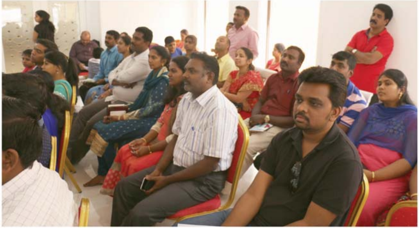
BOW & VOW SERVICE