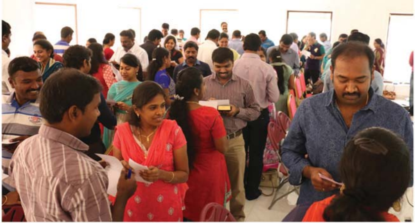
SING SONG SERVICE