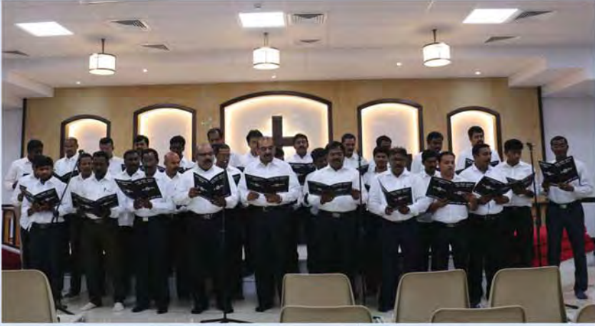
MAY DAY SERVICE