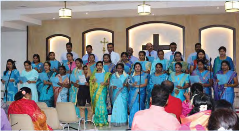
HEALTH WORKERS MEET