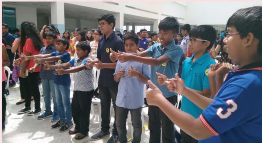
Jr. Ch. RETREAT