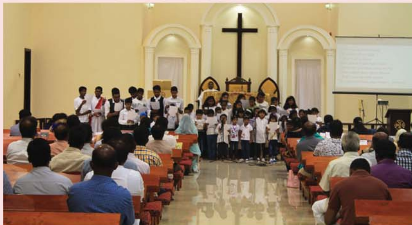
CHILDRENS DAY - RAK