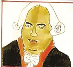
Father of Sunday School ♦ Robert Raikes ♦